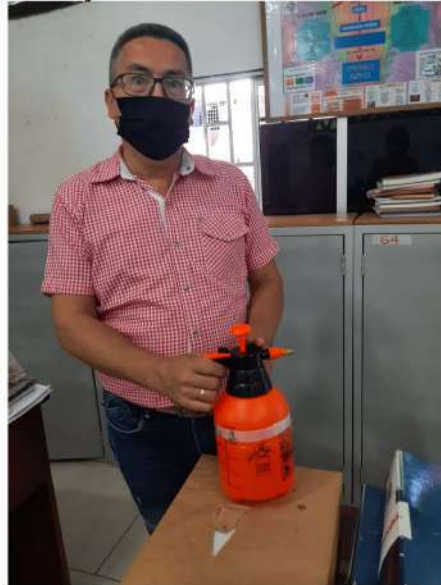
bomba de desinfección que se encuentra en cada salón